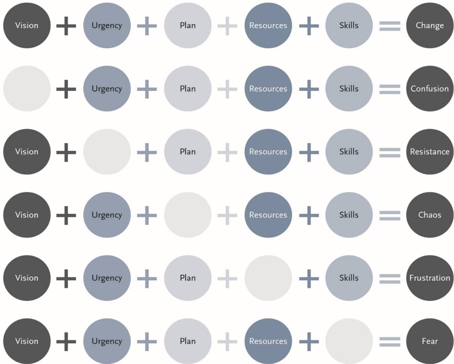
Image 19.4 Results of change management with and without Lippit's five elements