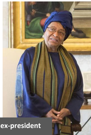
Ellen Johnson Sirleaf – ex-president Liberia

‘Als je niet bang wordt van je eigen dromen , dan zijn ze niet groot genoeg’